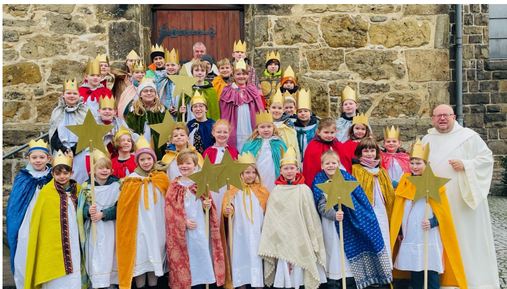
Das Foto wurde am Sonntag nach der Hl. Messe aufgenommen.

Auch in den Gottesdiensten am Sternsinger-Wochenende wurde für die gute Sache gespendet.