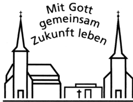
St. Laurentius · St. Urbanus