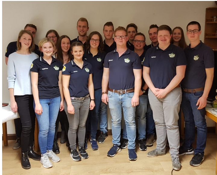
(DSGVO-Konformität wurde zugesichert)